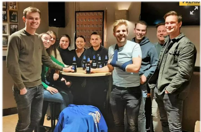
▲ Jongeren uit Alem willen heel graag in hun dorp blijven wonen.

Het is helaas een eentonig verhaal. De beloofde woningbouw in ons dorp heeft, zoals u inmiddels weet, twee jaar vertraging opgelopen. Beloofd was dat de eerste woningen van de geplande 50 (!) in 2024 zouden worden opgeleverd, nu staat de planning op 2026 en van de beloofde 50 zijn er nog maar 39 over. Wij vinden het bijzonder jammer en kwalijk dat veel jonge mensen uit ons dorp, die heel graag in Alem willen blijven wonen geen enkele kans hebben. Ons rest nu alleen nog maar te hopen dat de belofte door de gemeente nu wél wordt nagekomen.