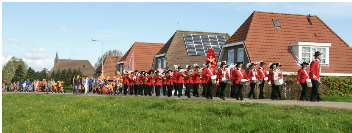
Fanfare Alem tijdens Koningsdag

Vanwege het 50-jarig bestaan worden er het gehele jaar door diverse mooie, muzikale activiteiten georganiseerd. Gestart werd met een prachtig Galaconcert in januari van dit jaar, daarna een Carnavalsconcert en in april werd een Seniorentour gehouden door op één dag 3 verzorgingshuizen te bezoeken en aldaar mooie optredens te verzorgen.