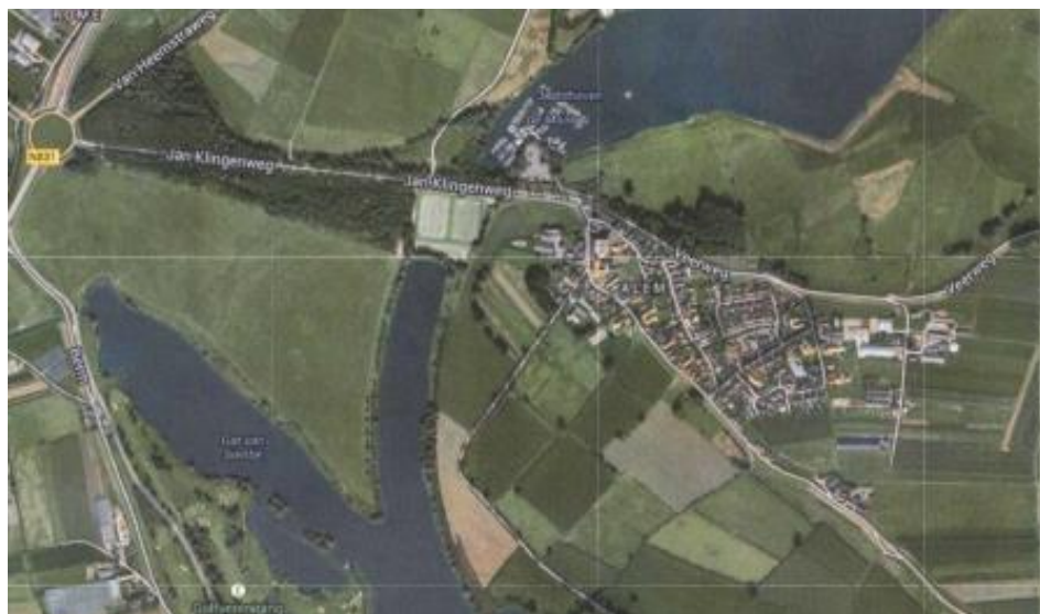
Maasmeander bij de Jan Klingenweg

De dorpsraad houdt de ontwikkelingen scherp in de gaten, want het open maken van de Maasmeander zal grote gevolgen hebben voor ons dorp, met name voor de voetbalclub en de jachthaven. Maar uiteindelijk voor alle inwoners van Alem. Wat niet duidelijk is, is op welke wijze Alem 'ontsloten' zal gaan worden en wat de eventuele compenserende maatregelen zullen zijn.