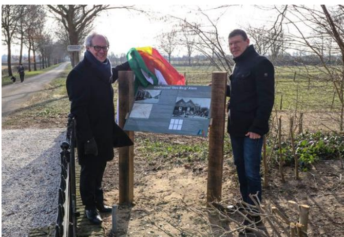
Opening van het informatiebord bij de Alemse grafheuvel.

-Meer informatieborden plaatsen, zoals onlangs bij de grafheuvel. Dit in overleg met de gemeente Maasdriel.