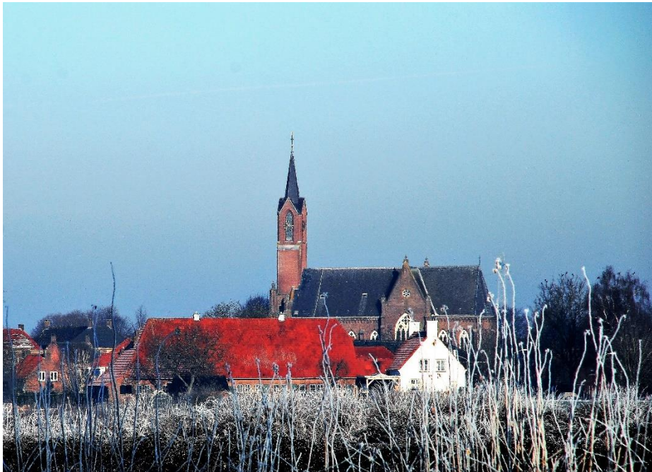
De Sint Hubertuskerk, winter 2017

De RK parochies in de Bommelerwaard zijn gefuseerd tot de 'Pastorale Eenheid Bommelerwaard'. De Hubertuskerk zou aanvankelijk verkocht worden, maar inmiddels is door het overkoepelende parochiebestuur besloten om de kerk nog tenminste 5 jaar open te houden. Voor de kleine, maar hechte geloofsgemeenschap is het openhouden van de kerk erg belangrijk.