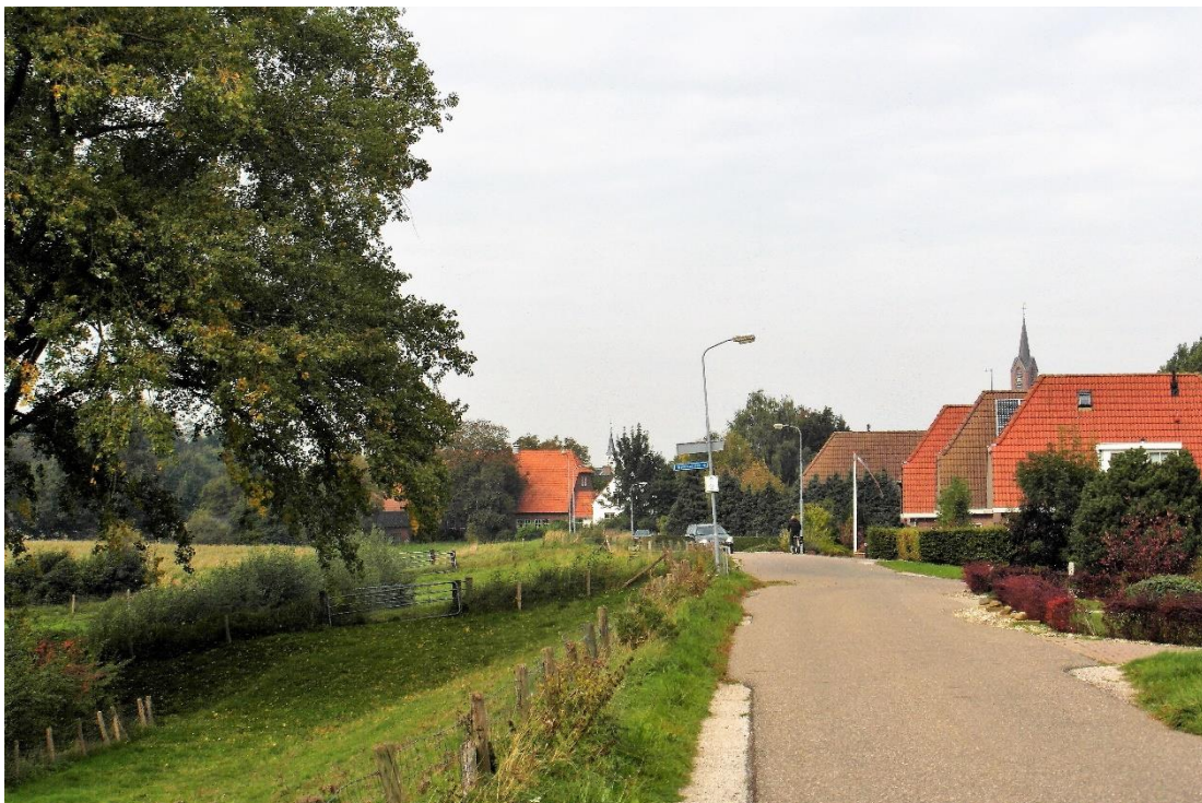
De Sint Odradastraat

Uiteindelijk zullen nieuwe, maar ook autochtone inwoners zelf moeten bepalen of, en in welke mate, zij willen deelnemen aan het dorpsleven.