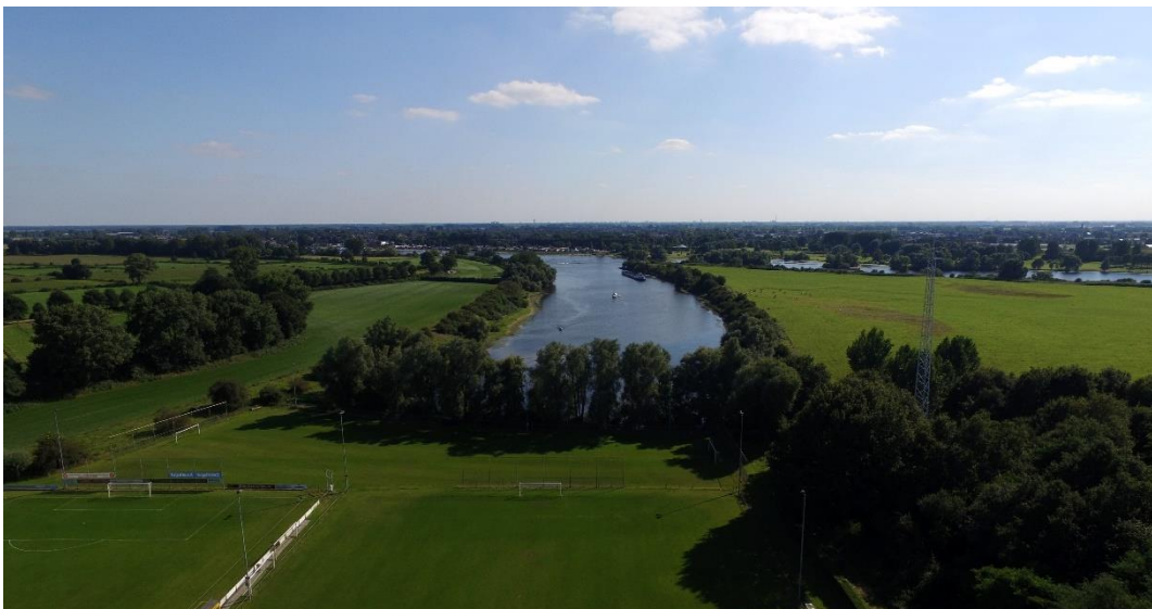
Loopt de Maas straks over het voetbalveld?

De dorpsraad is geen tegenstander van de plannen. De veiligheid van de inwoners staat voorop. Omdat het ontsluiten van de dode Maasarm grote impact heeft op het dorp zal de dorpsraad zich sterk maken voor goede compenserende maatregelen, niet alleen voor VV Alem en de jachthaven maar voor het hele dorp. De leefbaarheid van Alem mag niet lijden onder de uitvoering van de plannen. Wij zullen de ontwikkelingen op de voet blijven volgen en hierover in gesprek blijven met de gemeente Maasdriel.