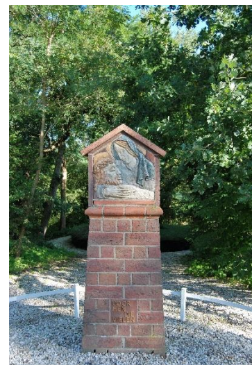
Oorlogsmonument aan de Jan Klingeweg