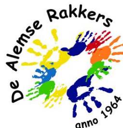
Bovenstaand: de logo's van enkele Alemse verenigingen