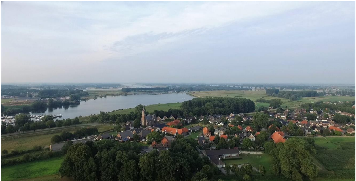
Gezicht op Alem

Om bovenstaande te bereiken zullen we vooral goed moeten overleggen met de gemeente en mogelijk de woningstichting. Tijdens het politiekdebat in het dorps huis, 2 februari 2018, waren alle aanwezige fractievoorzitters en politici vóór woningbouw naar behoefte in kleine kernen. We gaan er dan ook vanuit dat nu, na de verkiezingen, de politiek woord houdt en zich gaat inzetten voor de bouwproblematiek in kleine kernen.