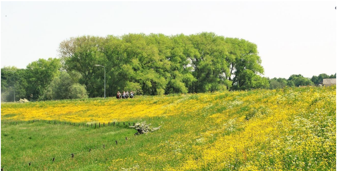
Lente 2018, bloeiende berm langs de Veerweg.